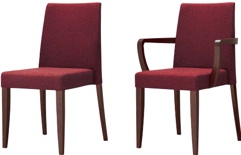
ベジェイスBR 11667-A E/布・ベベル6