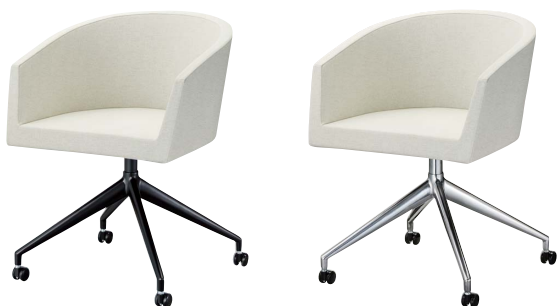
インクイスD (キャスター付) 21622-A D/レザー・フロワ1 脚部：ベースアルミ合金クロ塗装 (キャスター付) 座厚：55 受座：170角150ピッチ ※受座に上下・回転機能は、 付属しません。