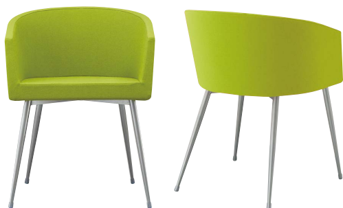
インクイスA-SG 21364-A E/布・パルパ031