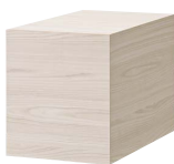
コンフルサイドテーブルWN W300 31320-S ¥49,800