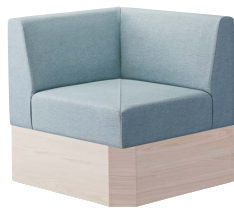
コンフルコーナー WN 31320-8