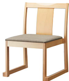
錦イスA (白木) 50552-A D/布・エイガT-9202

お好みに合わせて、背板塗装 (A) と背張り (B) から お選びいただけます。