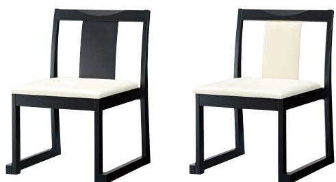
錦イスA (黒) 50554-A A/レザー・メトロ350