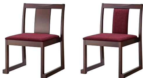
錦イスA (茶) 50553-A E/布・ベベル6