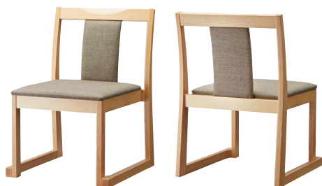
錦イスB (白木) 50555-A