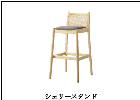
シェリースタンド