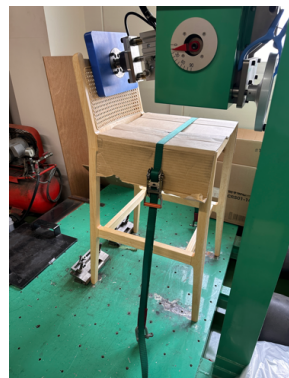
試験 ① JIS参考