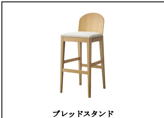
ブレードスタンド