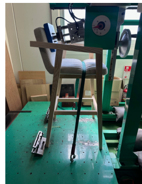
試験 ① JIS参考