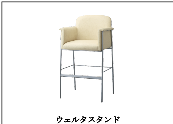
ウェルタスタンド